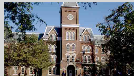
UNIVERSIDADE DO ESTADO DE OHIO COLUMBUS, OHIO