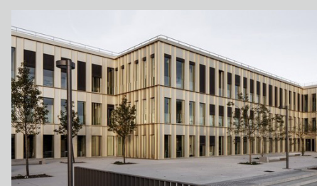
ESCOLA DE NEGÓCIOS, FRANÇA