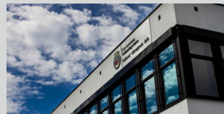
ESCOLAS DE OSLO (98 INSTALAÇÕES) OSLO, NORWAY

Visite-nos on-line em zenitel.com para obter mais informações sobre nossas referências e ainda mais projetos Vingtor-Stentofon.